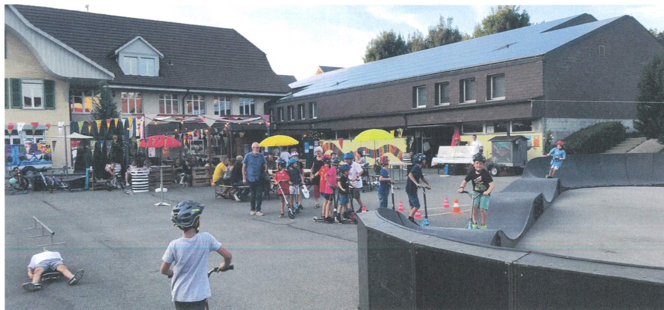
Pumptrack mit Bistro im Hintergrund

Durch die Vernetzung und die Zusammenarbeit innerhalb der Gruppe, durch das gemeinsame Lösen von Konflikten oder Schwierigkeiten wurden Selbst- und Sozialkompetenzen wie beispielsweise kommunikative Fähigkeiten gefördert. Ausserdem konnten die Jugendlichen in den vielseitigen Projektvorbereitungen ihre handwerklichen und kreativen Fähigkeiten erweitern. Nebst der Projektgruppe haben sich auch mehrere Vereine und Private aus Wichtrach stark in der Umsetzung und Planung engagiert. Durch die aktive Mitwirkung und viel freiwilliges Engagement der Jugendlichen, Vereine und Privatpersonen konnten verschiedenste Anlässe, Verpflegungsangebote, Transporte und der Aufbau des ganzen Areals realisiert werden. Im Rahmenprogramm fanden beispielsweise Spiel- und Bastelnachmittage mit dem Elternverein, Polysportparcours mit der Hornussergesellschaft, ein Pizzaabend mit der Bäckerei Bruderer, Kaffee-Treffs mit der IG Wichtrach und Eltern, Spiel &