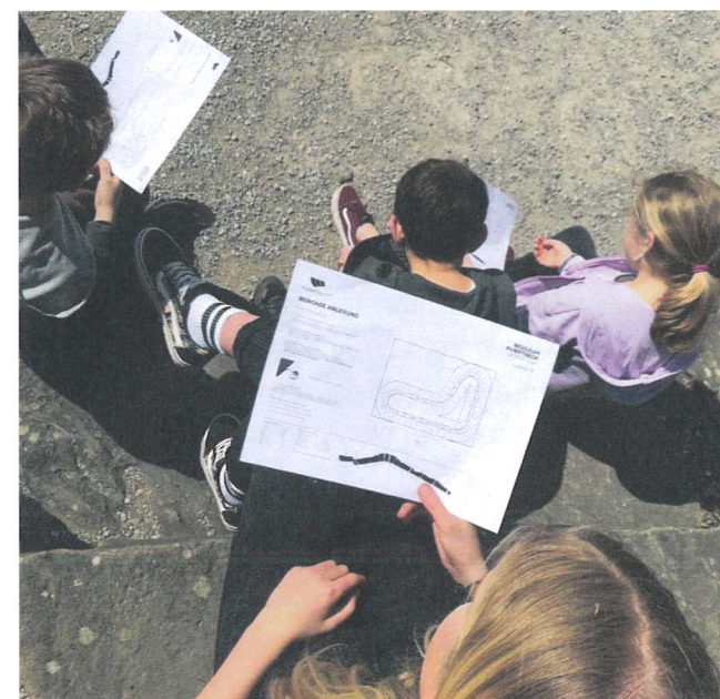
Situationsplanung auf dem Areal am Bach im März 2022

Das Projekt war gesamthaft ein grosser Erfolg und hat diesen Sommer in Wichtrach für die Besuchenden und die mitwirkenden Jugendlichen zu etwas Besonderem gemacht.